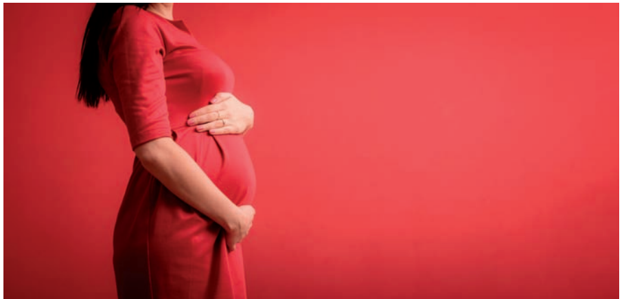
Des perturbations émotionnelles de la mère pendant son dernier mois de grossesse modifie physiquement la structure du cerveau de son bébé. (Dr. Boris Cyrulnik)